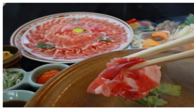
.. 黒豚しゃぶ ..