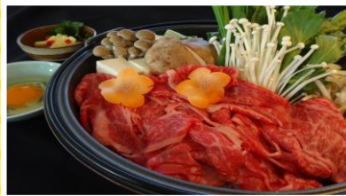
.. 牛すき焼 ..