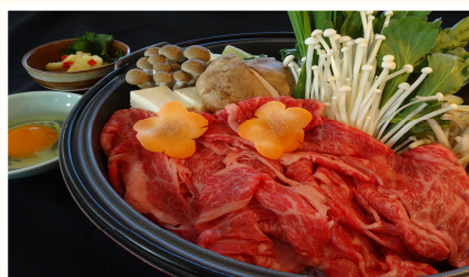
.. 牛すき焼 ..